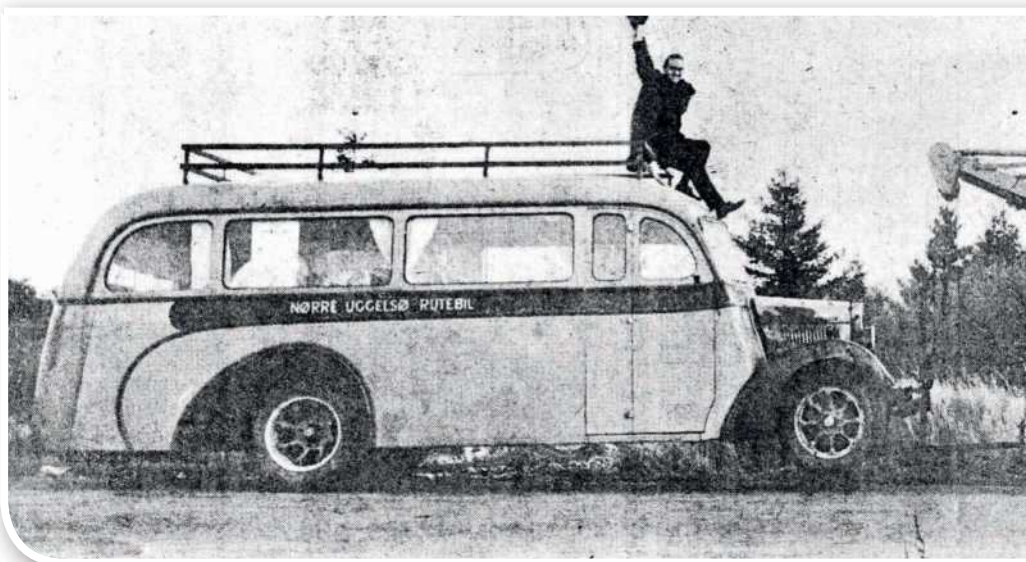
REO'en på vej til Store Magleby bag Falck-Zonens kranvogn og med »Myggen« siddende på taget.